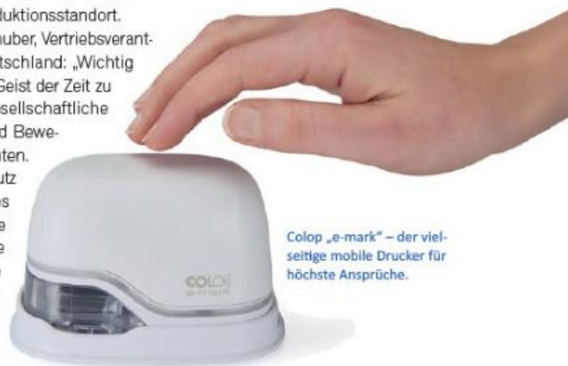
Colop „e-mark“ – der vielseitige mobile Drucker für höchste Ansprüche.

Mit dem „e-mark“ hat Colop, ein Unternehmen, das bisher vor allem für traditionelle Stempel bekannt war, einen Durchbruch im mobilen Druck erzielt. Der „e-mark“ basiert auf der Inkjet-Technologie und funktioniert in Kombination mit einer kostenlosen Software für